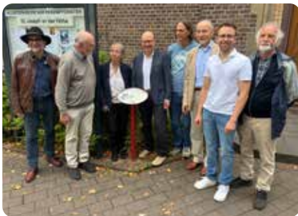
Artikel Historische Punkte:

heimatkundlich in Bonn, im Kreis Ahrweiler und in der Eifel aktiv, lieferte die Texte. In einem kurzen Beamer-Vortrag erläuterte er anhand zweier Beispiele das Konzept. Während die gewachsenen Siedlungen über identitätsstiftende Bauten, Straßen und Plätze verfügen, die ein historisches Bewusstsein entstehen lassen, ist das bei Auerberg erheblich schwieriger. Diese Zeugnisse in Auerberg offenzulegen ist das Konzept der „Historischen Punkte“. Anhand der aufgestellten Info-Tafeln mit QR-Code-Verweisen auf die Homepage des Ortsausschusses soll der Werdegang des jungen Bonner Ortsteils der Öffentlichkeit nähergebracht werden. Wegen der hohen Zahl zugezogener Menschen, soll das Projekt die Identifikation sowohl mit dem Ortsteil Auerberg als auch der ganzen Stadt Bonn als neue Heimat unterstützen. Deshalb stehen die Texte auf der Homepage auch in englischer, türkischer und arabischer Sprache.